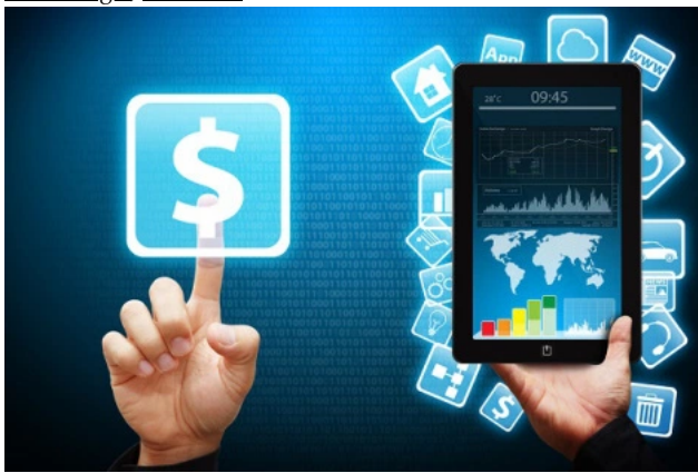
( https://finbuzzactu.files.wordpress.com/2015/09/fintech-apps.jpg )

10 septembre 2015 · par finobuzz · dans Actualités , Finance , Fintech , Innovation / R&D , Investir , Nouvelle génération , Nouvelles du monde , Relève Technologie , Tendance ·